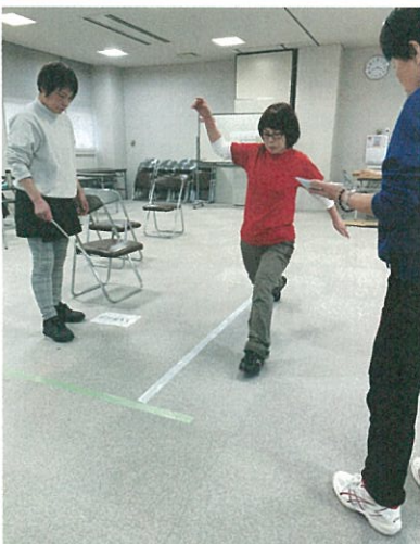
「体力チェック測定法を学ぶ」

7月28日(日)に第1回目が始まり、全9回の講座として昨年に引き続き開催しています。昨年の取り残しの方と今年度の受講生と数名ですが、南越前町の南条保健福祉センターを会場に、月1回のペースで進めています。受講生の様子から、具体的な支援技術を伝える場となっていることを感じます。