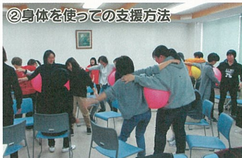
《ぎゅーと持ったり、挟んだり》

『ふらば～』は感触が優しく、ピンクと黄色という色も鮮やかで不思議な動きをするレクリエーション用具です。講習会では、『ふらば～』の特性・特徴を活かして3種類の支援方法を紹介しました。参加者達は、心も体も元気になって笑いの多い講習会になりました。「発想が広がり、ひらめきがどんどん湧いてさっそく現場で使えそうです。」「現場で使ったら、認知症の利用者さんが喜びそうです。」等の声が聞かれました。