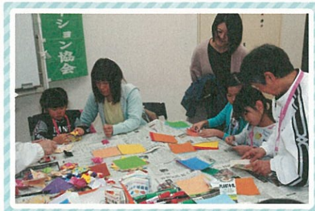
「折り紙折ってコマづくり」