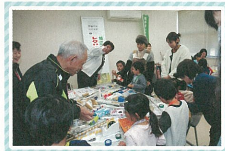
「トイレットペーパーの芯 とべ～」