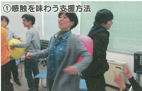
《二人で一緒に押し合いも》