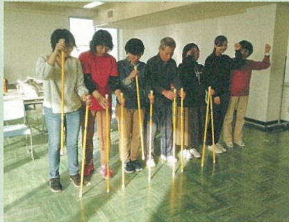
「チャレンジ・ザ・ゲームの体験」

今年度のレクリエーション支援基礎講座は、3名から10名と講座ごとに参加人数を変更しながら進めてきました。最終的に、受講生3名がインストラクターを取得する予定です。2月に実技検定、3月に面接をして正式に「レクリエーション・インストラクター」となります。実技検定では約45分のプログラム作成したものを実技します。6月からの講座で学習したアイスブレイキングの技法やコミュニケーションの技術を盛り込んでのプログラム作成！講師や検定を受けない参加者とのやり取りを通して実際の現場で使えるよう、受講生の皆さんは頑張っています。