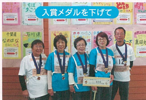
入賞メダルを下げて

ねんりんピックウォークラリーでは、初参加で6位入賞しました。「やったー！嬉しい！」チーム5人大喜びでした。今年、和歌山県由良町でウォークラリーが開催されました。晴天の中、私達は10時22分スタートでした。待っている間はドキドキ大丈夫かなと不安な気持ちと頑張ろうという前向きな楽しみの気持ちでいました。最初の打ち合わせで、時間は90分で戻ってくることに、「コマ図」を見て知らせる人、見つける人、全体を見る人と役を決めました。でも問題は思っていたより難しく、最初のチェックポイントから考え込んでしまいました。由良町のことはしっかり調べてきた私達でしたが、和歌山県全体を調べないことは反省です。経験のある人のアドバイスと初参加のひらめき、また気心の分っているスロージョギングのチームワークが6位入賞できたのだと思います。素晴らしい経験ができたことに感謝です。(報告：吉川啓子)