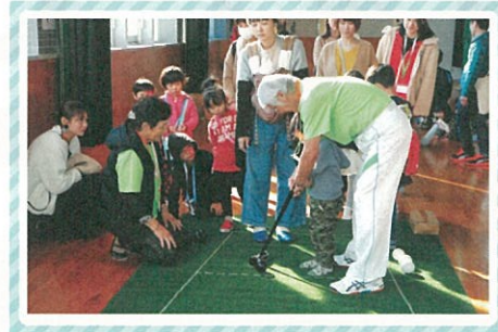
「ボールよ、くぼみにとまれ!」