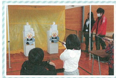
「なっとうやまんばやっつける!」