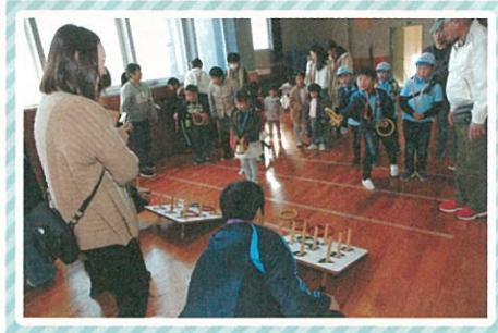
「ねらってなげて・・・」