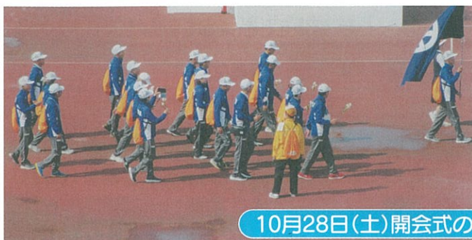
10月28日(土)開会式の様子

10月27日(金)に福井を出発し、28日(土)は開会式、その後は各競技の会場へ移動。29日(日)はカローリングは八幡浜市、ウォークラリーは上島町にて大会参加した。