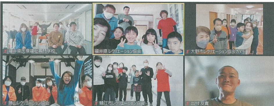
大野市の会場様子